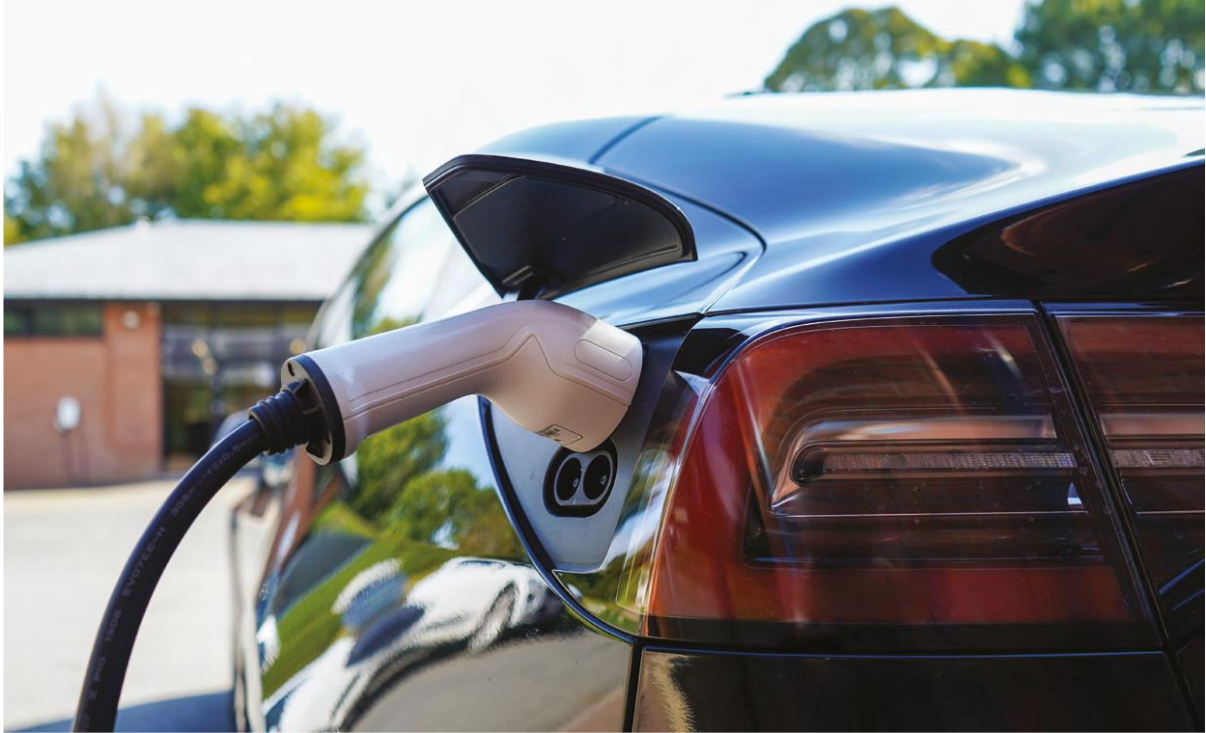
Les véhicules électriques sont alimentés par des batteries contenant des minerais comme le cobalt, le cuivre, le lithium et le nickel.

En 2019, l'organisation a appelé le secteur à « rendre ses batteries propres » dans un délai de cinq ans 6 .